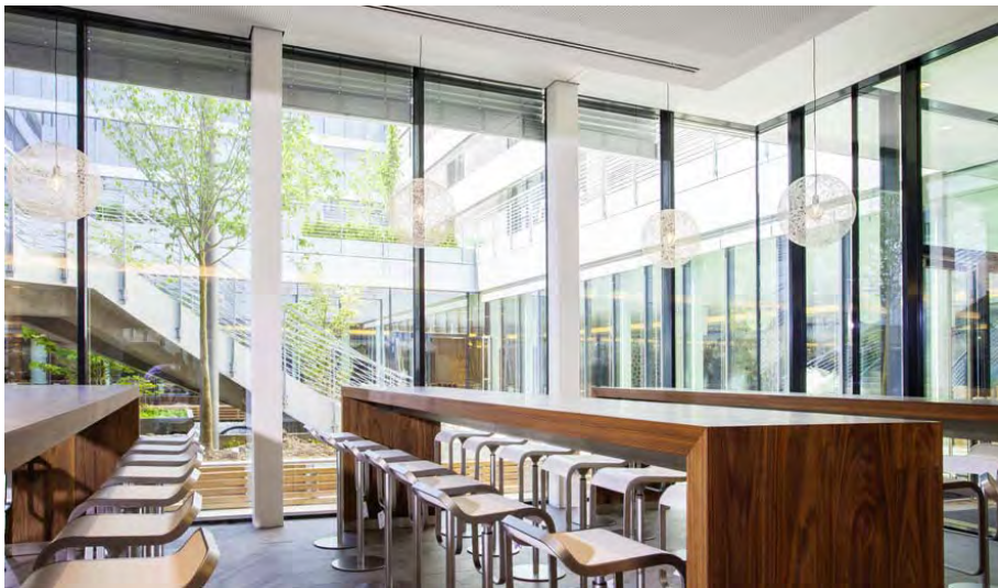
Bürokomplex MÜ 15_46923_09