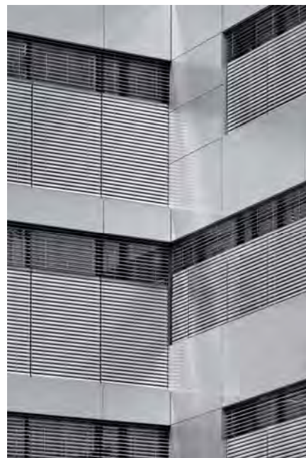
Rechts: Bürokomplex MÜ 15_46946_28