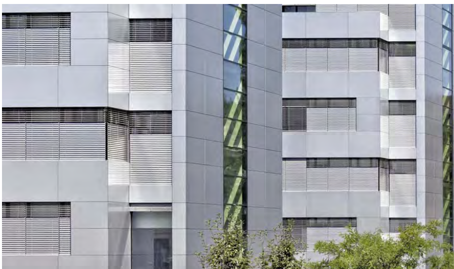
Bürokomplex MÜ 15_46946_27