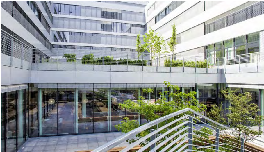
Bürokomplex MÜ 15_46923_12