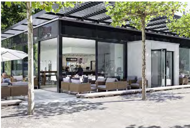
Bürokomplex MÜ 15_46946_30, ©Rohde & Schwarz

Weitere Fotos finden Sie auf beiliegender CD.