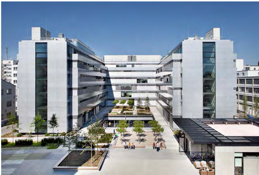
Bürokomplex MÜ 15_46946_28