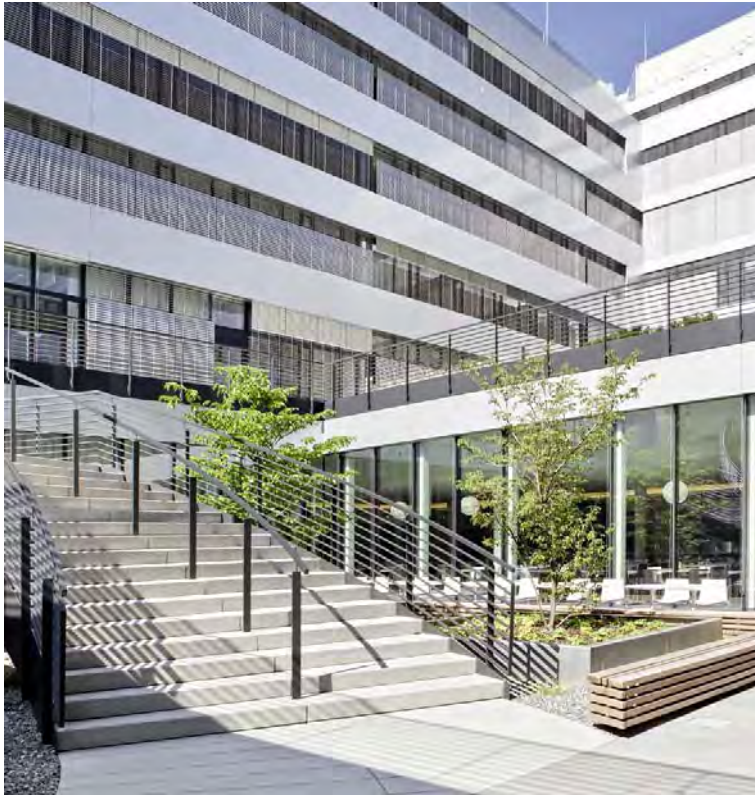
Bürokomplex MÜ 15_46946_20